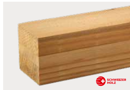
tr Tanne Natur ddd gedämpft