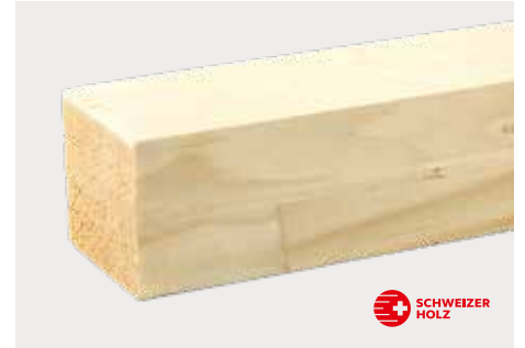
tr Fichte zum Streichen kkk