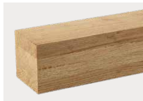
Eiche europäisch Natur dkd