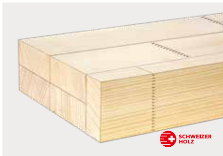
tr Fi/Ta zum Streichen optina Futter I