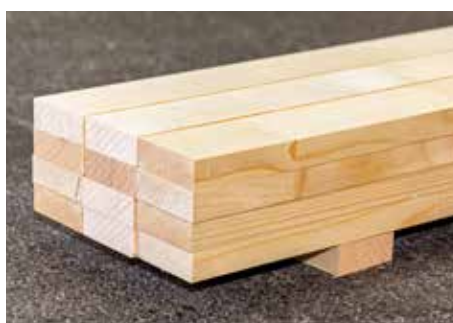
Leisten Natur und zum Streichen