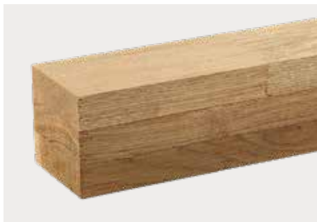
Eiche zum Streichen kkk