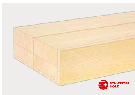
tr Fichte Natur optina Futter I