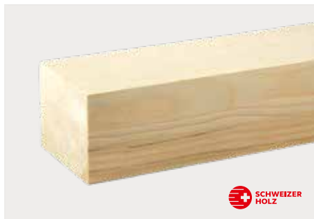
tr Tanne Natur ddd