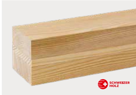
tr Tanne zum Streichen ddd