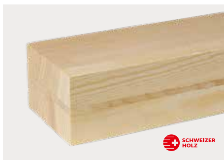
tr Föhre Natur ddd