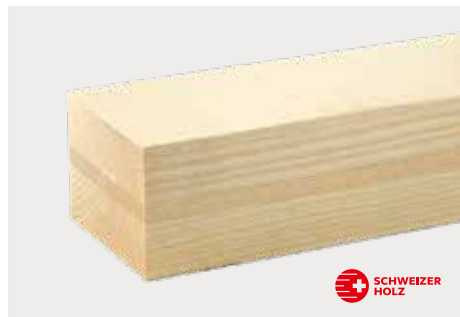
tr Fichte Natur ddd