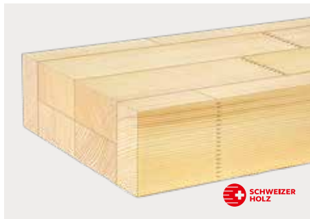
tr Fi/Ta zum Streichen optina Futter II