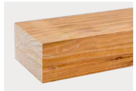
Accoya zum Streichen