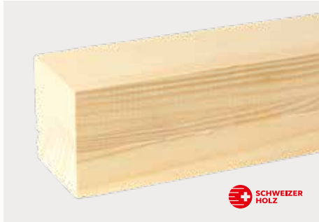
tr Fichte zum Streichen ddd