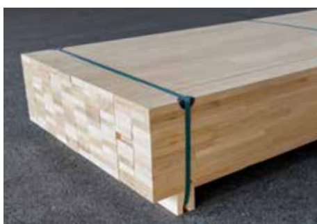
Stangen zum Streichen