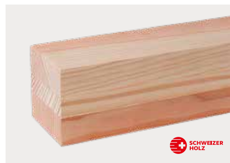
tr Douglas Natur ddd