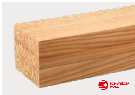
tr Lärche europäisch Natur ddd