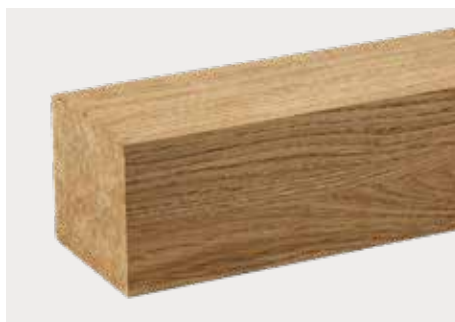
tr Eiche europäisch Natur ddd