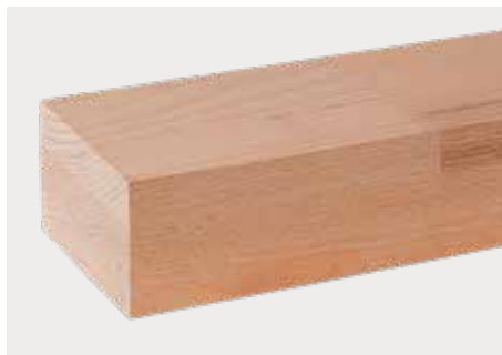
Buche zum Streichen kkk